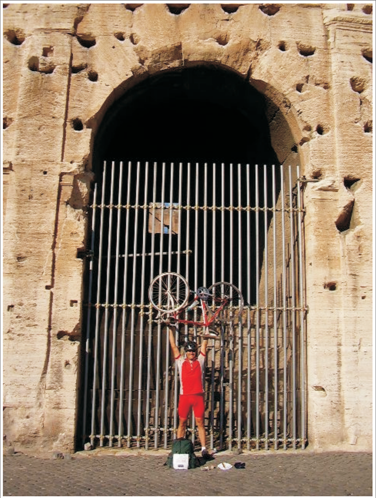
Ende und Neubeginn.